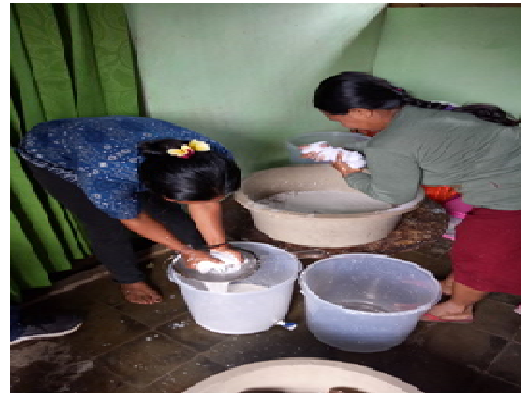
Gambar 3. Proses Produksi KWT

dalam wadah yang bersih, kemudian dibiarkan selama 2 jam hingga terbentuk kanil . Kanil dipisahkan dengan kandungan air dan dimasukkan ke dalam wadah lalu didiamkan selama 6 jam. Sambil menunggu terjadinya pemisahan antara Londo dengan air dan bibit VCO. Bibit VCO disaring sesering mungkin, maka hasil akan semakin bagus dan awet.