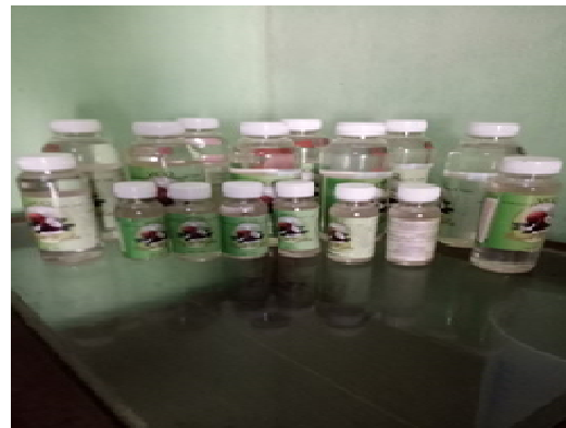
Gambar 4. Produk VCO KWT Nadi Sari

Pada gambar 4.4 di bawah merupakan contoh hasil produk UKM KWT Nadi Sari dengan hasil Virgin Coconut Oil (VCO). Untuk produk VCO ada 3 jenis dengan ukuran 150 ml seharga Rp.35.000, ukuran 250 ml seharga Rp.65.000 dan Ukuran 500 ml seharga Rp.130.000.