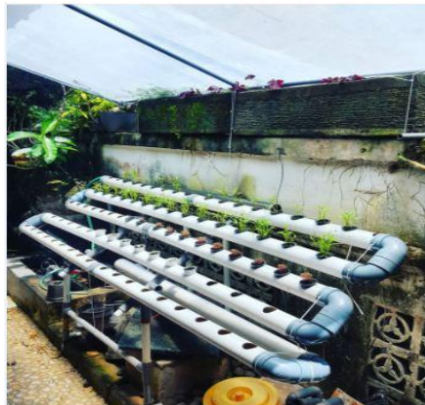
Gambar 2. Salah satu contoh aquaponik .

Teknologi aquaponik merupakan gabungan teknologi aquakultur dengan teknologi hidroponik dalam satu sistem guna mengoptimalkan fungsi air dan ruang sebagai media pemeliharaan. Teknologi ini telah dilakukan di negara – negara maju, khususnya yang memiliki keterbatasan lahan untuk pengoptimalan produktivitas biota perairan. (Ristiawan dkk, 2012). Di bawah ini merupakan gambar salah satu aquaponik